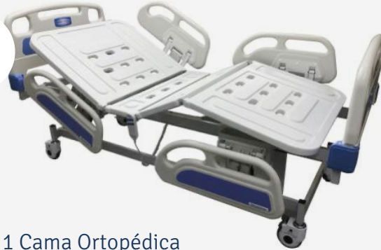
1 Cama Ortopédica Eléctrica para UTI