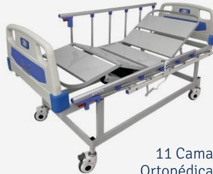
11 Camas Ortopédicas Eléctricas

El municipio y el HCD adquirieron 11 camas de internación y 1 cama de Terapia Intensiva para ser entregadas al Hospital Enfermeros Argentinos.