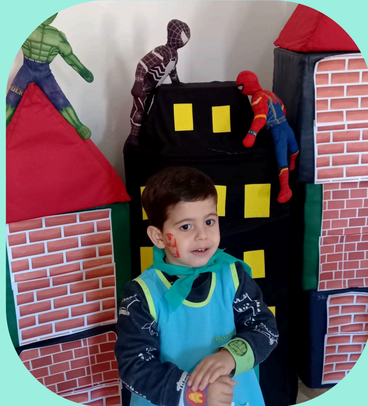
JUEGO Y ARTE