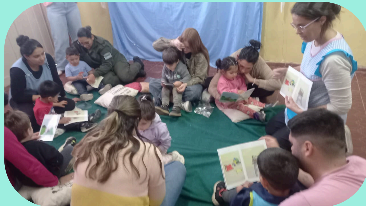
NATURALEZA Y AMBIENTE NATURAL